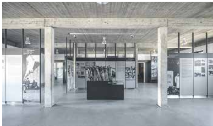
Blick in Hauptausstellung.

DARMSTADT – Die Wissens- schaftsstadt Darmstadt organisiert gemeinsam mit dem Jugendring Darmstadt e.V. und dem Jugendbildungswerk erneut eine Gedenkstättenfahrt für junge Menschen.