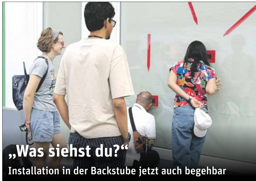
„Was siehst du?“ Installation in der Backstube jetzt auch begehbar

EBERSTADT – Im Kunstraum Backstube wird die Installation „Was siehst du?“ der Künstlerin Ulrike E Sticher erstmals für Besucherinnen und Besucher zugänglich gemacht.