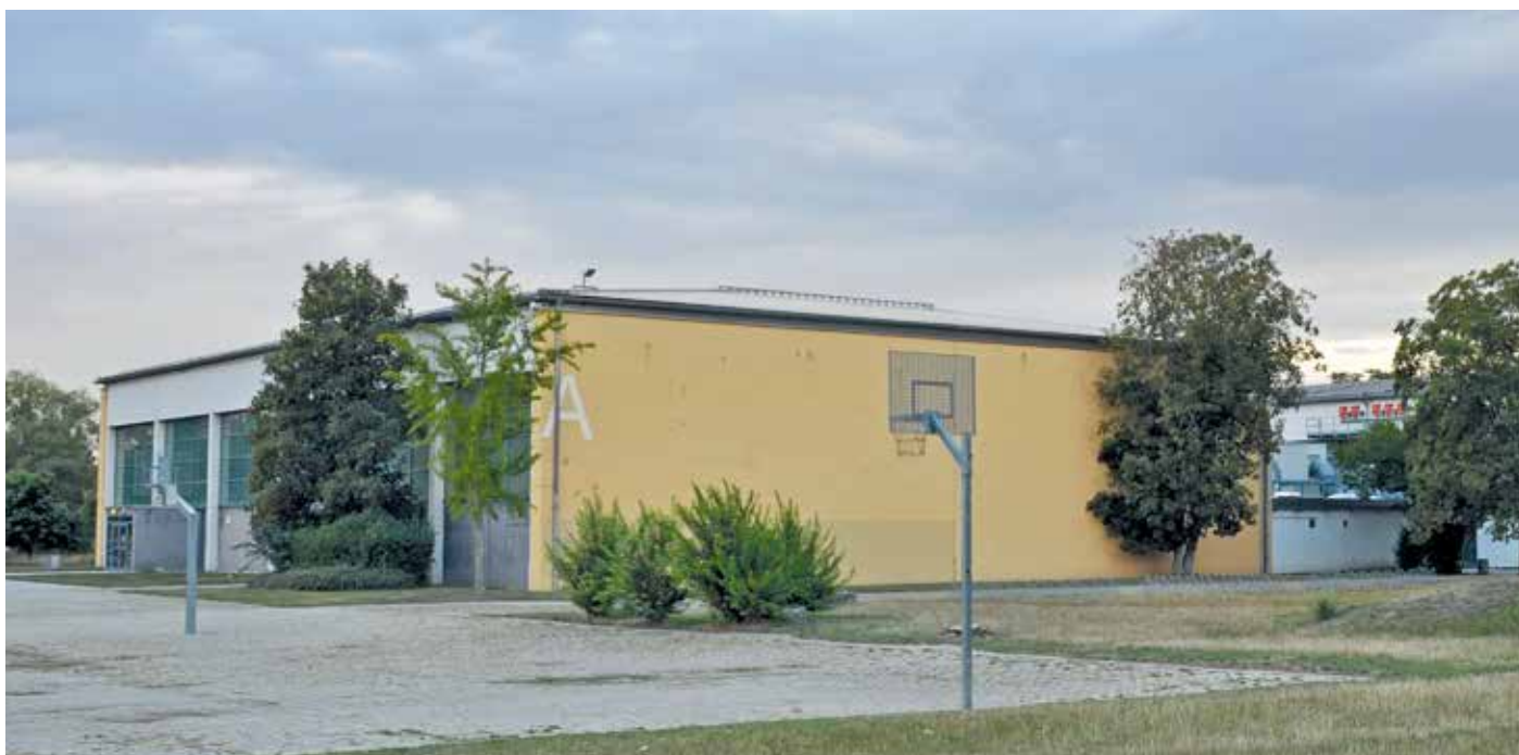
In den Sporthallen an der Martin-Buber-Schule in Groß-Gerau richtet der Kreis sein Corona-Impfzentrum ein.

Damit die schnelle Inbetriebnahme des Impfzentrums möglich ist, wird noch zusätzliches medizinisches Personal benötigt. Es sollen am Standort MBS und von mobilen Impfteams (die zum Beispiel in Altenheime gehen) täglich von 7 bis 22 Uhr in drei Schichten Menschen geimpft werden - auch am Wochenende. Damit sollen mindestens 1000 Impfungen am Tag ermöglicht werden. Für diese Aufgabe benötigt der Kreis Unterstützung durch medizi-