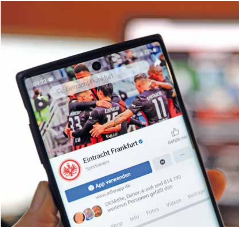
Eintracht Frankfurt ist auf allen Kanälen aktiv, hier bei Facebook.

Selbst die Vereine auf dem Siebertreppchen liefern der Untersuchung zufolge zwar sehr solide, aber keinesfalls perfekte Webauftritte ab. Beim Social Commitment dokumentiert Spitzenreiter Bremen seine sozialen Aktionen umfangreich und stellt Projekte abwechslungsreich vor. Auffällig sei, dass alle Vereine in diesem Bereich aktiv seien, ihre Engagements jedoch erheblich besser und nachhaltiger in ihre Gesamtauftritte einbinden könnten, heißt es in der Studie.