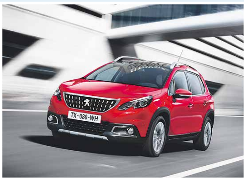
■ PEUGEOT Flat-Rate-Angebote Seite 5