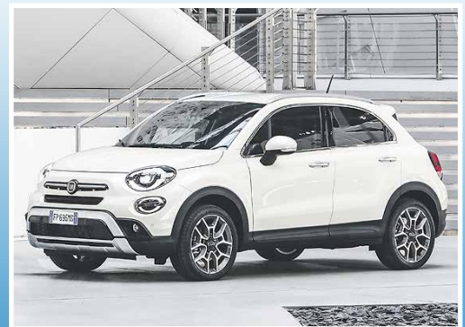
■ Fiat 500X – Gewachsen für die Zukunft Seite 10