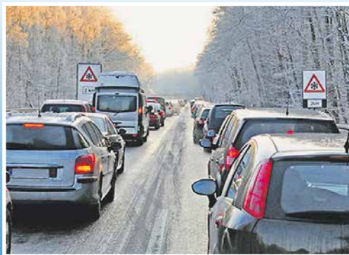
■ Was Autofahrer über Blitzeis wissen müssen Seite 6