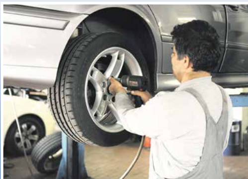
■ Herbstzeit ist Winterreifenzeit