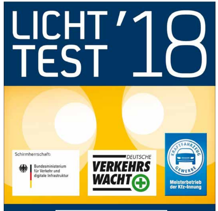
Die offizielle Licht-Test-Plakette.

Lassen Sie die Beleuchtungsanlage ihres Autos überprüfen, damit Sie gut und sicher durch die dunkle Jahreszeit kommen.