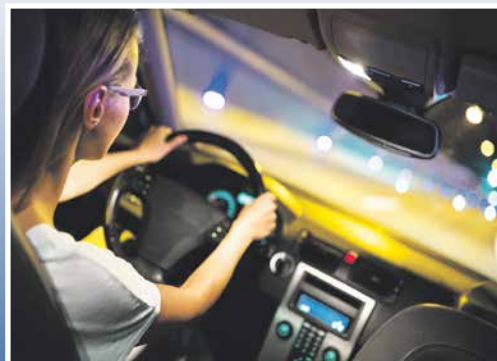
■ Licht-Test 2018