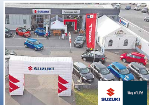
■ AVS Oktoberfest 2018