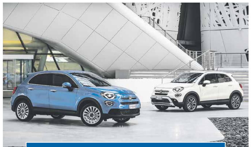
Neuaufgabe eines Bestsellers: Der neue Fiat 500X.

Der komfortable Innenraum des neuen Fiat 500X verwöhnt mit hochwertigen Materialien, erstklassiger Verarbeitung und einer Vielzahl von Staufächern und Ablagen. Je nach Kombination von Sitzbezügen, Verkleidungen und Farben sind sieben unterschiedliche Versionen des Innenraums möglich. Der körpergerecht geformte Sitz, bequem erreichbare Bedienelemente, der in Griffweite am oberen Ende der Mittelkonsole positionierte Schalthebel und die Armstütze zwischen den vorderen Sitzen erhöhen den Komfort für den Fahrer.