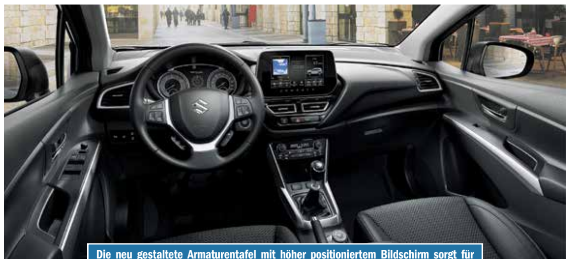
Die neu gestaltete Armaturentafel mit höher positioniertem Bildschirm sorgt für hohen Bedienkomfort in angenehmem Ambiente.