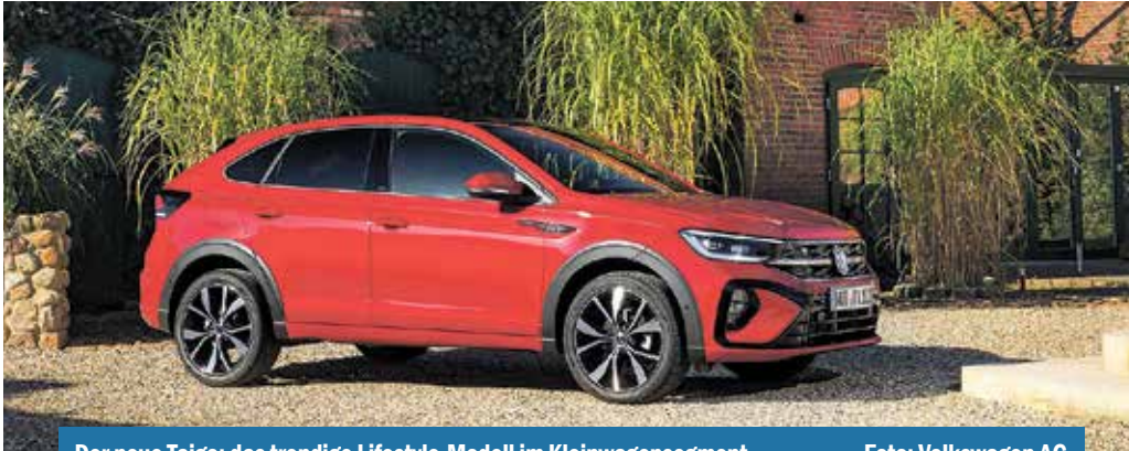
Der neue Taigo: das trendige Lifestyle-Modell im Kleinwagensegment.

Modell soll weitere Kundengruppen im Kleinwagensegment erschließen