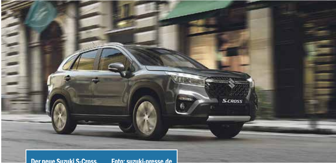
Der neue Suzuki S-Cross.

Kraftvolles SUV-Modell mit robuster Optik und starker Präsenz