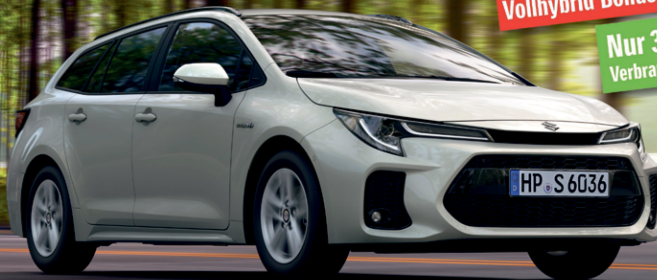
Abbildung zeigt aufpreispflichtige Sonderausstattung.