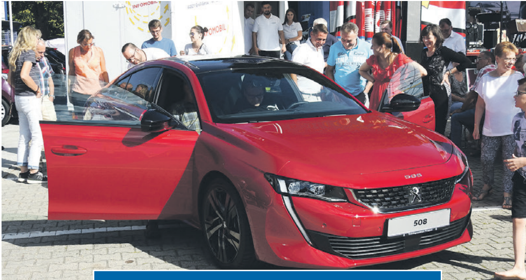
Große Aufmerksamkeit erregte die Vorstellung des neuen Peugeot 508 auf dem Kundendankfest im Autohaus Arscholl, Groß-Gerau.