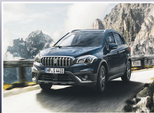
■ Suzuki SX4 S-Cross. Seiten 10 +12