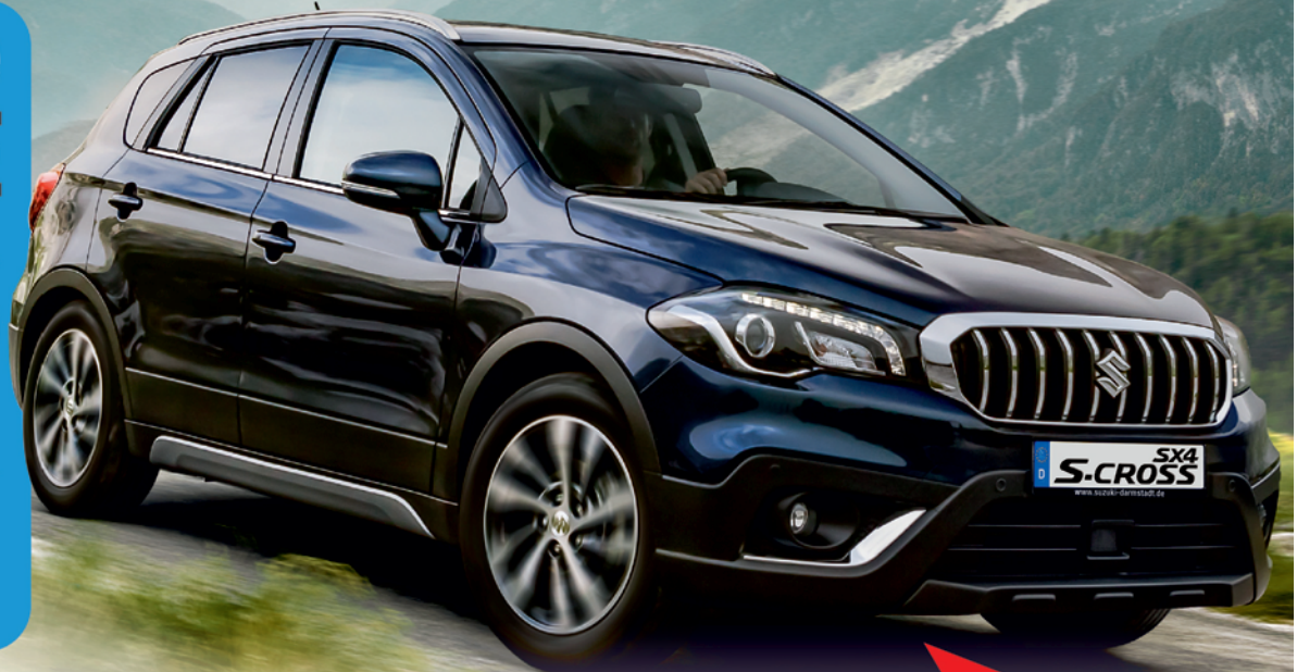
Abbildung zeigt Sonderausstattung.