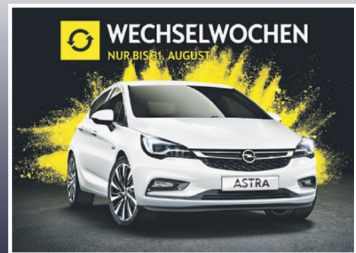
■ Die Opel Wechselwochen. Seite 11