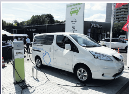
■ Neue Wege in die Zukunft. Seite 2